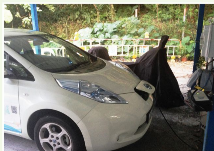
能源效益 使用零排放電能車。