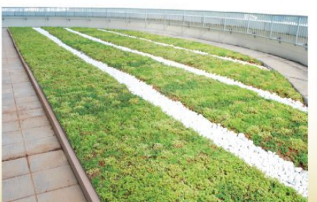
▲ 綠色天台有助減低大樓內的溫度，從而節省電力。