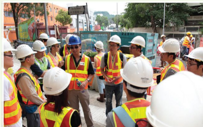
環保推廣 受建造業議會邀請，合辦工地參觀。

恭賀 AECOM 榮獲香港綠色企業大獎2013 — 優越環保管理獎(企業) — 項目管理 — 銀獎