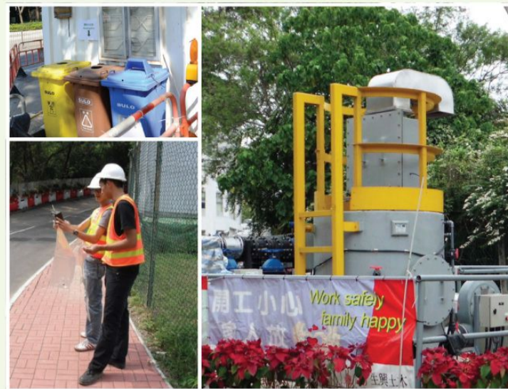
噪音、空氣、水質污染控制及廢物管理 邀請附近居民一同見證噪音管制。委託專業人士監測異味；在有限的工地使用分離機加速沉澱；工地內放置環保回收筒進行分類。

AECOM「北區及吐露港區域污水收集」項目，採納多項環保管理措施，並達致零投訴、零違例紀錄的驕人成績：