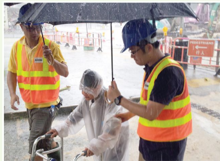
環境管理及公共關係 工程一向用心出發，深受公眾認同。