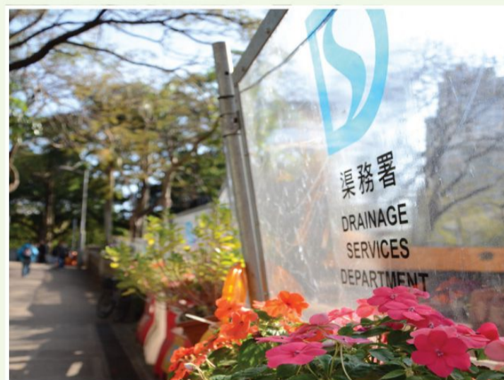
工地衛生及整潔 在工地的透明圍板外種植花卉，以改善工地外觀，令工地融入周圍環境之中，減少對景觀的影響。